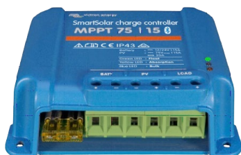
SmartSolar Laadcontroller MPPT 75/15